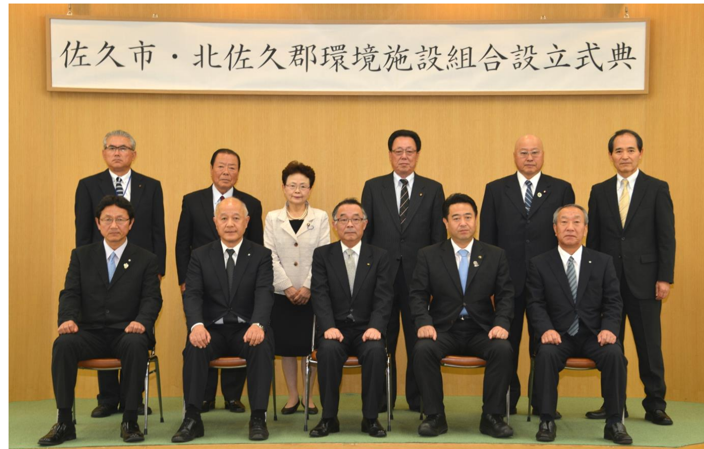
▲来賓、正副組合長・会計管理者記念撮影

平成26年10月1日、佐久市役所にて「佐久市・北佐久郡環境施設組合設立式典」が挙行されました。式典に先立ち、開催された1市3町首長会議では、佐久市・北佐久郡環境施設組合(以下「一部事務組合」)の組合長に、佐久市長が互選され、軽井沢町長、立科町長、御代田町長、佐久市副市長の4名が、副組合長に就任しました。