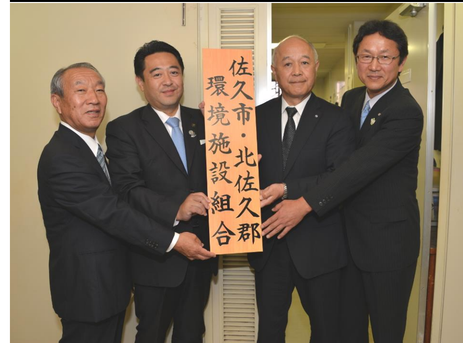
▲正副組合長による一部事務組合事務所の看板設置

また、これまで長期にわたり、1市3町の中心となって事業を進めてきた佐久市はもとより、組合構成団体である軽井沢町、立科町、御代田町と、一部事務組合とが、連携を密に、更なる協力体制を維持していきながら、本事業を推進してまいります。