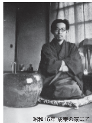
昭和16年 成宗の家にて