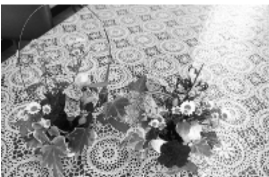
心理相談室に飾られた生け花

2 点目は、花が大好きな子 が、初めてフラワーアレンジ メントに挑戦したものです。 一本一本大事に扱いつつ心を 込めて生けていました。