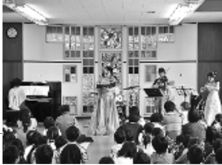
ひだまりっこ 「三館合同秋の音楽鑑賞会」 10月4日(大林児童館)

子どもたちが遊び 親たちも楽しめる そんな交流の場があります。 親子で手をつないで ぜひ遊びに来てください。