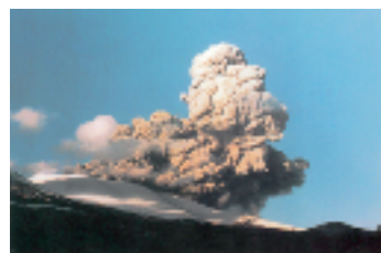
昭和48年の前掛山の噴火

およそ1万年前からは、前掛山が成長を始めた時代となり、現在に続いている。前掛山では天仁元年(1108)と、天明三年(1783)に大規模な噴火が起きたことがわかっている。