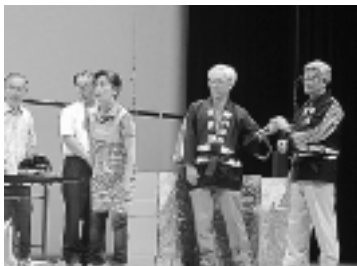
「はつらつサポーター」の寸劇 おばあちゃんがいなくなってしまい、 家族や消防団が探している様子

はつらつサポーターのオリジナル寸劇では、おばあちゃんが認知症を発症し、家族が戸惑いながらも認知症状を理解し、近所など地域と支え合って、生活をしていく様子を笑いも交えながら発表しました。