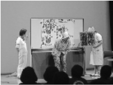
松代町認知症サポーターの寸劇

松代町認知症サポーターの発表では、認知症状の場面ごとに説明と寸劇があり、例えば認知症状の一つ「物盗られ妄想」では、おばあちゃんが嫁に「財布を盗った」と責める場面がありますが、嫁は優しく説明し一緒に探すなど、介護者の正しい対応の説明もありました。