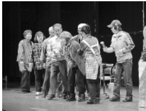
サポーターによる寸劇の一場面です!!