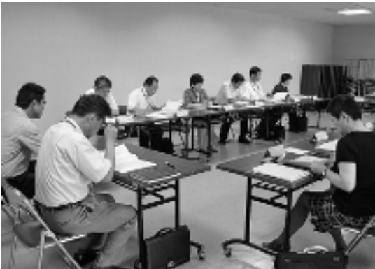
「御代田町虐待等防止ネットワーク協議会」では、乳幼児から高齢者に至るまで、虐待防止のため、地域と様々な専門職が協力して対応ができるよう取り組んでいます。

「虐待や悪質商法の被害にあった」、「認知症の人が行方不明になり何日も見つからない」、「一人暮らしの高齢者が孤立死した」など、こころとした悲しい事件を防ぐためには、地域の皆さまの見守りと気がきが鍵を握ります。現に最悪のケースに至る前に、実は周囲の人は異変に気付いていたということも少なくないのです。「ちよっと変だな」と感じたら、地域包括支援センターへご連絡ください。結果として何も起こらなければ、それに越したことはありません。 * 守秘義務により、連絡者が特定されたり、連絡したことで不利益になることはありません。