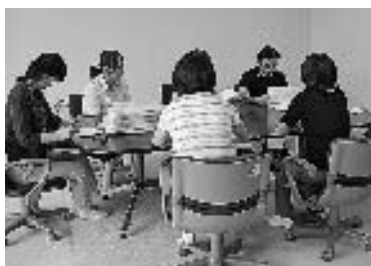
面接方式で指導チームからケアプランについてのアドバイス

ケアプラン作成のプロセスが適正であり、提供している介護サービスの判断根拠が妥当なものであるか点検します。