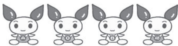
献血キャラクター