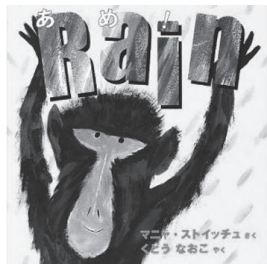
『あめ!』 マニャ・ストイッチュク/さくどうなおこ/やく ポプラ社

そろそろ梅雨の季節です。長く続く雨は嫌なものです。が、ときには待ちわびた雨もあります。 今回は、外国の絵本から、恵みの雨の本を紹介します。