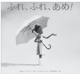
『ふれ、ふれ、あめ!』 カレン・ヘス/作 ジョン・J・ミューズ/絵 岩崎書店

「なにごとなの？」と外に出てきた大人たちも、雨が降ってきたことを知ると、笑顔になり、靴を脱ぎ捨て、雨の中を踊りだします。 『ふれ、ふれ、あめ!』 からから天気が続く夏の日、テッシーは空に向かって「ふれ、ふれ、あめ!」と言いました。通りのあちこちで植物がぐったりしています。そのとき、遠くの空に雲がわき出ているのを見つけたテッシーは、友達を誘いにいき、路地裏で雨を待ちます。 ふいに降り出した雨の中で、女の子たちはくるくる回り、笑い、叫びます。