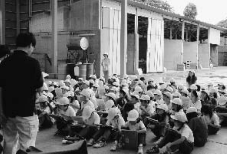
井戸沢最終処分場社会科見学(南小学校4年生)