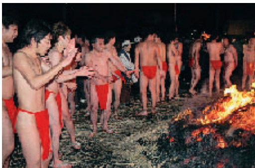
冷えた体をわら火で温める

1年で最も寒いと言われる大寒の時期である1月20日に毎年行われています。今年集まった72人の水行者は、ふんどし一丁の裸姿で、頭に兜巾をかぶり、わらじを履き身支度を整え、午後6時一斉に出発。外に飛び出た行者は、区内7ヵ所に用意された桶から、水を汲み出して体に浴び、凍てつく道进行き、熊野神社に兜巾を奉納。最後は冷えた体をわら火で温めた。