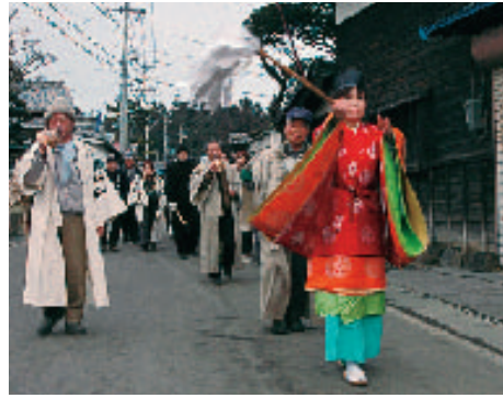
先祓いが、道を清め、行事の開始を告げる