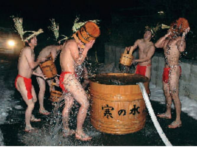
水行者は勇壮に水を浴びる