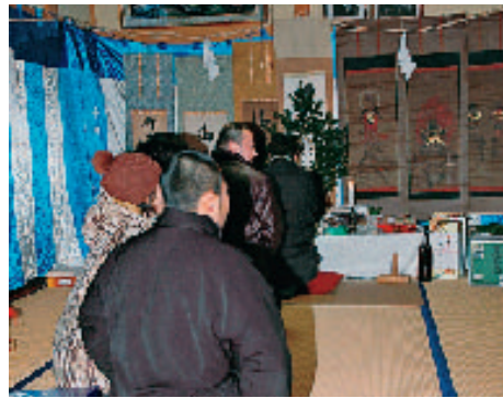
水行者当番宿へあいさつ