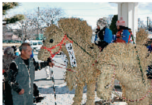
ハートピアみよたで交流