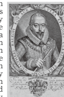
Engraving of Raleigh (1617)

Sir Walter pioneered English colonization in North America. In 1584 he dispatched ships that discovered Roanoke Island. And in 1585 and again in 1587, he sponsored the establishment of colonies there. He named the vast area that was claimed by England Virginia in honor of Elizabeth, "the Virgin Queen". Raleigh led expeditions to Guiana in 1595 and 1617 in search of famed city of gold, El Dorado. Raleigh's obsession with finding the city eventually led to his downfall, as his second expedition in 1617 was a failure, resulting in his son's death. Furthermore, he during the expedition he attacked a Spanish outpost, breaking a peace treaty with Spain, and upon returning to England he was executed for his actions. Many speculate his execution was also due to him having made exaggerated claims/failing to find gold. So ended an illustrious career full of swashbuckling, exploration, and court intrigue. I have no space to talk about his writings and poetry but please look them up if you are interested! Thank you for reading, see you next time.