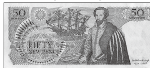
Raleigh on the English 50 pence note (1969 - never issued)

Apologies, this entry is not technically a person on the pound. The note in question is actually a denomination of the subunit of the pound, the penny. Moreover, this note was never actually issued as legal tender. It was designed and proofs were made. But it was never issued for circulation because the Royal Mint decided to use the new 50 pence coin instead. I hope you'll forgive me!