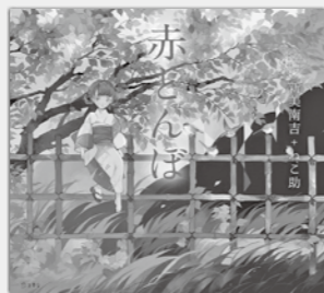
『赤とんぼ』 新美南吉／著 ねこ助／絵 出版：立東舎

セミはうるさい。でも、セミの声はきこえない世界より、マジカもしれない。 『いっぽんのき』 昔は雑木林や畑が広がっていた場所も、今はビルが立ち並ぶ都会に。そんな街の小さな公園に、一本の木が残っていた。木の下で出会った、おばあちゃんとはじめちゃんは、一匹のセミを見つけて…。