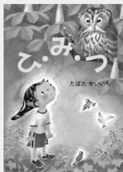
『ひ・み・つ』 たばたせいいち／作 出版：童心社

あなたにとって、歴史にとって、人にとって、音楽とは何かを見つめてゆく一冊。 『脳は耳で感動する』 なぜ人は音楽に感動するのか？映像と音楽のシンクロはどのように起こるのか？解剖学者・養老孟司と作曲家・久石譲が対談し、脳科学の視点から音楽の魅力、脳と音楽の不思議な関係に迫る。