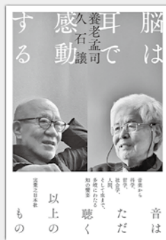
『脳は耳で感動する』 養老孟司・久石譲／著 出版：実業之日本社

あなたにとって、歴史にとって、人にとって、音楽とは何かを見つめてゆく一冊。 『脳は耳で感動する』 なぜ人は音楽に感動するのか？映像と音楽のシンクロはどのように起こるのか？解剖学者・養老孟司と作曲家・久石譲が対談し、脳科学の視点から音楽の魅力、脳と音楽の不思議な関係に迫る。