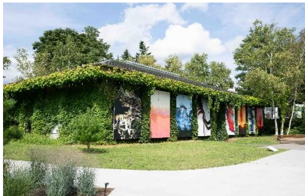
※写真は令和7年開催の様子

町は株式会社アマナ（本社：東京都品川区）と共同で8月1日（土）から9月27日（日）まで、「浅間国際フォトフェスティバル 2026 PHOTO MIYOTA」を開催します。「浅間国際フォトフェスティバル」は、浅間山麓の美しい自然の中で、五感で感じられるさまざまな写真体験ができるアートフォトの祭典です。国内外の優れた写真家たちの作品展示や、写真の楽しさを提案する体験型のイベントの実施により、写真文化と地域の魅力を町内外に発信します。