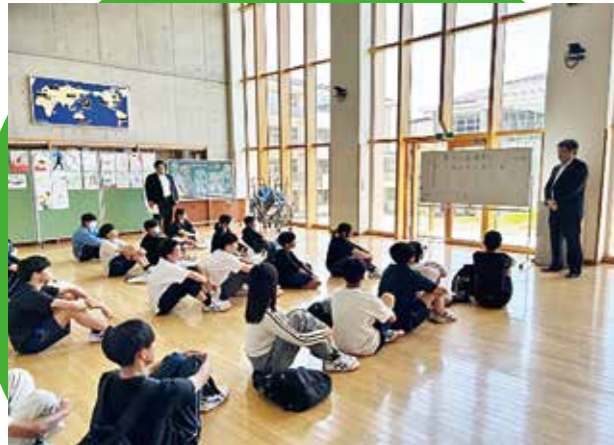
夢サポート塾の開講式

昨年から国語を選択科目として追加しており、好評だった面接対策講座を引き続き実施することで、中学3年生の学力試験対策をサポートしていきます。