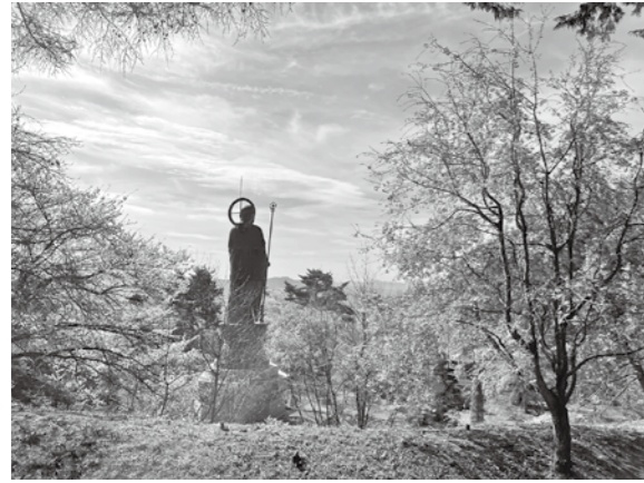
しゃくなげ公園まつりの日

協力隊として企画した「みよた暮らし交流会」が5月17日に開催されました。ご参加いただいた皆さま、ご協力いただいた皆さま、ありがとうございました。またお会いできる日を楽しみにしています！