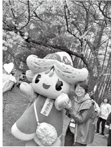
しゃくなげ公園まつりにて