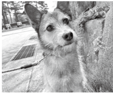
にぼちゃんの散歩