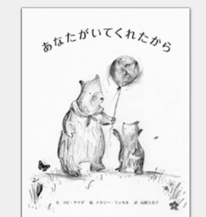
『あなたがいてくれたから』 コビ・ヤマダ/文 ナタリー・ラッセル/絵 高橋久美子/訳 出版：パイインターナショナル

「おいしい味つけ黄金比」 比率通りに調味料を合わせれば、いつでも同じ味でおいしい料理が完成する。それが「味つけ黄金比」。定番料理はもちろんのこと、食材を替えたアレンジ料理まで、幅広くレシピを紹介する。