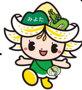
御代田町観光キャラクター みよたん ©