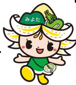
御代田町観光キャラクター みよたん ©