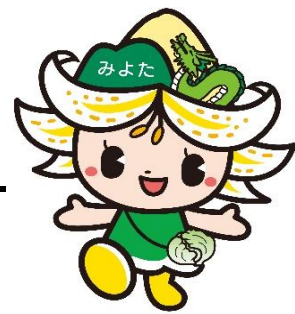
御代田町観光キャラクター みよたん ©