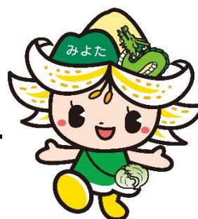
御代田町観光キャラクター みよたん ©