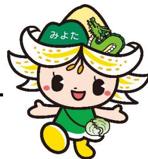
御代田町観光キャラクター みよたん