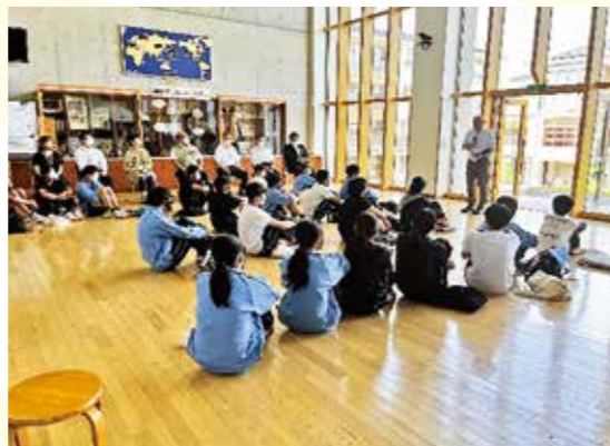
夢サポート塾の開講式

より多くの生徒の皆さんの夢や目標に貢献できるよう毎年、内容を見直し改善し、魅力ある講座となるよう運営してまいります。