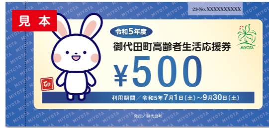
※応援券のデザインは変更となる場合があります。