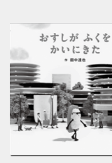
『おすしがふくをかいにきた』 田中達也/作 出版:白泉社

「道草の解剖図鑑 野草の魅力と見方、楽しみ方を徹底図解」 市街地や公園、田畑の周り、水辺などでこくふつに見られる野草約219種を、春から晩秋まで花の咲く時期で分け、イラストで紹介。見た目が似ている植物の見分け方、観察のポイント、野草の味わい方・遊び方などがわかる。