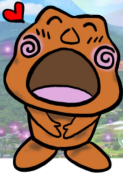
御代田町公式LINEスタンプ 縄文土器「御代田町のあくびちゃん」