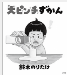
「大ピンチずかん」 鈴木のりたけ / 作 出版：小学館

「大ピンチずかん」 ガムを飲んだ！トイレの紙がない！？！子どもが出会う世の中の様々な「大ピンチ」を、大ピンチのレベルの大きさと、5段階のなりやすさで分類。レベルの小さいものから順番に掲載し、その対処法をユーモアたっぷりに紹介する。