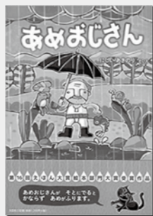
「あめおじさん」 にしいあきのり / 作・絵 出版：文芸社

「あめおじさん」 あめおじさんが外に出ると、必ずあめがふります。子どもたちも、近所の奥さんも、窓ふき職人さんも、みんなおじさんに「あした、一歩も外に出ないでください！あさってだったらいいですよ」と言ってしまう。