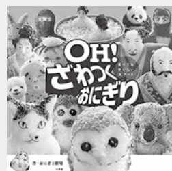
『OH! さわつくおにぎり』 おにぎり劇場/作 出版: 小学館

「OH! さわつくおにぎり」 おにぎり作りの修練を重ねた結果、より写真的に、よりユーモアのあるおにぎり作りに成功。三毛猫おにぎり、河童おにぎり、武田信玄おにぎりなど、アートの域にまで高めた立体的なおにぎりを、作り方とともに紹介する。