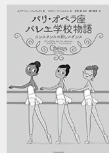
『パリ・オペラ座バレエ学校物語』 エリザベット・バルフェティ/著 マガリーヌ・フートゥリエ/絵 高野優監、瀬川愛美/訳 出版: 竹書房

「パリ・オペラ座バレエ学校物語」 名門バレエ学校に通う新入生コンスタンスは、まじめでがんばり屋。ある日大事な公開授業で転んでしまい、舞台上立つのが怖くなってしまふ。そんなとき、新しいダンスをすすめられて…。フランスで人気の児童文学。