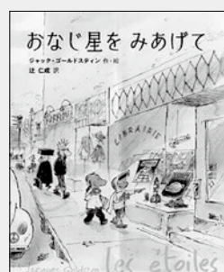
『おなじ星をみあげて』 ジャック・ゴールドスティン/作・絵 辻仁成/訳 出版: 山崎

「おなじ星をみあげて」 彼女とぼくはいつまでも、宇宙について話しあっていた。ただ、どこか、どんな違いがあっても「好き」はそれを乗り越え、広がっていく。カナダを代表するバンド・デシネ(フランス語圏のマンガ)作家のポリー・ミーツ・ガールの物語を、辻仁成が邦訳。