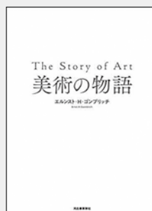
『美術の物語』 エルンスト・H.ゴンブリッチ/著 天野衛ほか/訳 出版: 河出書房新社

「美術の物語」 原始の洞窟壁画から現代の実験的な芸術にいたる、美術の全体を論じた入門書。色々名前や時代や様式がわかりやすく整理できるように工夫し、物語としての美術史を目に見えるように描き出す。