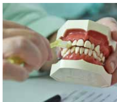
正しいブラシの使い方

歯の健康を維持するためには、早め早めに正しくケアをする必要があります。今回の無料歯科健診をうまく利用して、いつまでも自分の歯で食事を楽しめるようにしてほしいです。