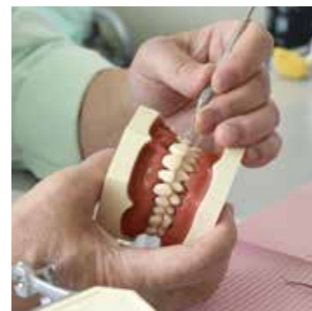
歯周ポケットを測る様子

Q: 虫歯は分かりやすいですが、歯周病ってあんまりピンときませんが、歯が抜けたりするものですか? 関先生…ひとむかし前までは、歯が抜ける病気のように思われていました。最近では生活習慣病の一つとして、認知されてきていますし、糖尿病と歯周病の関係も有名になってきました。歯周病が悪化すると糖尿病も悪化し、歯周病を抑止すると糖尿病も改善するといった事例があります。