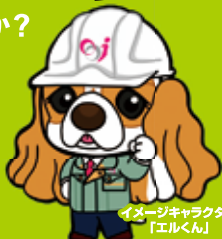
イメージキャラクター「エルくん」