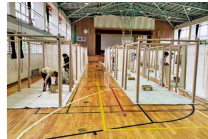
間仕切り組み立て中

8月14日、15日にかけての大雨は全国各地に多くの被害をもたらし、御代田町でも大雨警報(土砂災害)が発表され、役場設置の雨量計では降り始めから止むまでに178mmを記録しました。町では職員によるパトロール、被害状況の共有を図り、14日の夕方に自主避難所を北小学校体育館、南小学校体育館に開設しました。感染症対策とプライバシー保護のため間仕切りを設置し、自主避難者の受け入れ態勢を整えました。