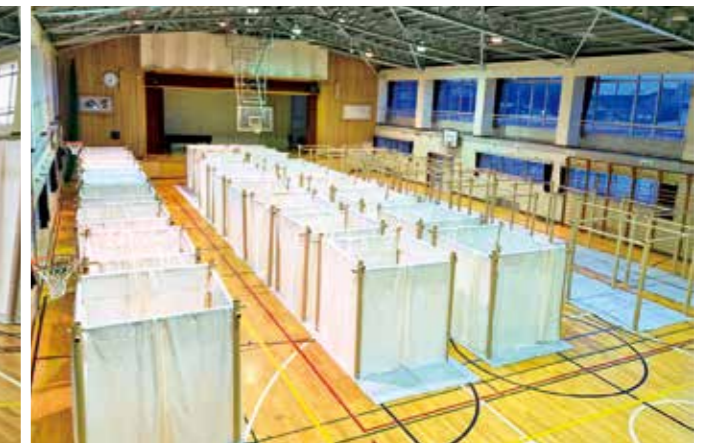
間仕切り組み立て後