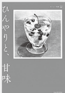
『ひんやりと、甘味』 阿川 佐和子ほか/著 出版:河出書房新社(おいしい文藝)

『じべた』 時々、空がうらやましい「じべた」でも、花が咲くと空を忘れます。機械がやってきて、高いビルを建てて、「じべた」は隠れたけど…。詩人・谷川俊太郎と画家・黒田征太郎、ふたりの想う「じべた」を描き出す。