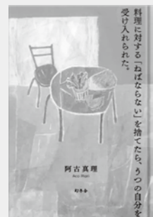
『料理に対する「ねばならない」を捨てたら、うつろの自分を受け入れられた。』 阿古 真理 / 著 出版:幻冬舎

『料理に対する「ねばならない」を捨てたら、うつろの自分を受け入れられた。』 36歳、うつ発症。料理ができなくなった食文化のジャーナリストが発見した22のことは…。自身のうつ体験を、回復の手助けになった料理を通して描く。