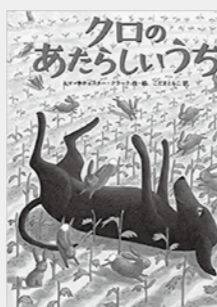
『クロのあたらしいうち』 エマ・チチェスター・クラーク/作・絵 こだまともこ/訳 出版:徳間書店

『ひんやりと、甘味』 ここに、涼あります。冷たいスイーツにまつわる随筆集。阿川佐和子、池波正太郎、色川武大、立川談志、戸川幸夫、松井今朝子、丸谷才一、吉村昭らによる全41篇を収録。『おいしい文藝シリーズ』所載しています。お楽しみください。