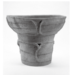
いろいろ 写真: 囲炉裏に使った土器 (国重要文化財)

※新型コロナウイルスの影響で入館者の地域制限、臨時休館などがあります。お越しの際は、お電話でお問い合わせいただくか、ホームページをご確認ください。