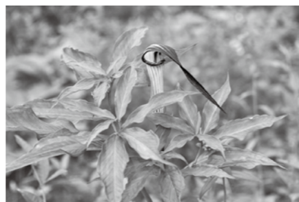
カルイザワテンナンショウ 花は6月上旬～7月上旬頃

※軽井沢町植物園では、園内の排水路改修工事を行っています。工事の状況により季節展示がご覧になれない場合があります。