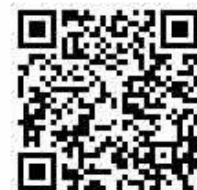
PR動画「私の、ふるさとになる。」

ガルテナー出演の「信州みよたクラインガルテン大星の杜・面替PR動画(30 秒CM)」もぜひご覧ください！！