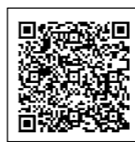
町ホームページ 二次元コード