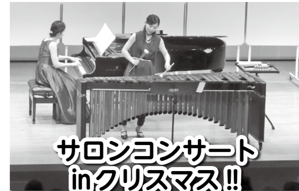
サロンコンサート inクリスマス!!

「身近に生の音楽に触れる機会を」と、エントランスホールで30分間の「サロンコンサート」を開催しています。