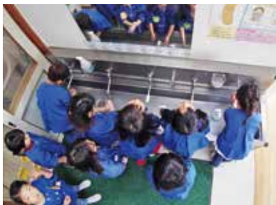
手洗いうがいを徹底して行う園児たち