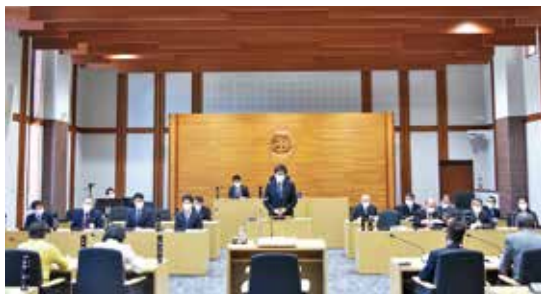
議会もマスクを着用して実施