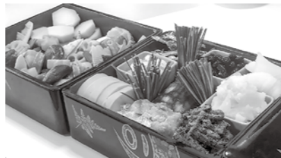
12月20日 農で繋がる女性のための交流会