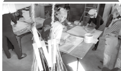
12月15日 そば打ち・しめ縄作り交流会