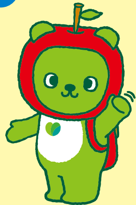
長野県PRキャラクター「アルクマ」 ©長野県アルクマ