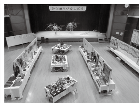
総合文化展の様子