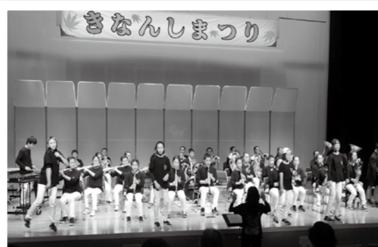
芸能発表会の様子

日程 11月9日(土) 時間 午前10時～午後4時 場所 エコールみよた あつもりホール