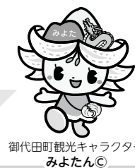
御代田町観光キャラクター みよたん

改元というタイムリーな話題の詐欺手口のため、今後も同様な文書が届く場合が予想されます！十分に気を付けましょう！