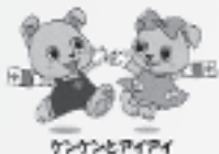
ガンガンとアイアイ

輸血医療は代わり得るものがなく、生命を救う唯一の手段が献血です。血液だけは人工的に造ることができません。病気やけがの人々のため、皆さんの献血が必要です。ご協力をお願いします。