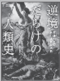
『逆境だらけの人類史』 ビル・ブライス／著 定木大介、吉田句子／訳 日経ナショナルジオ グラフィック社

英雄たちのあっぱれな決断 困難に直面し、八方塞がりになり陥っても、人類は大英断を下して歴史を動かした！初期人類が作った最初の石器から、ベルファスト合意の締結まで、歴史上の47の大英断を写真や絵画を交えて紹介する。