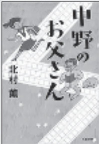
『中野のお父さん』 北村 薫／著 文藝春秋

新人賞候補者からの思いがけない一言は？大物作家宛ての手紙に愛の告白？若き体育会系文芸編集者の娘と、定年間近の高校国語教師の父が、出版界で起きた様々な「日常の謎」に挑む！『オール讀物』掲載を単行本化。