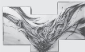
池田龍雄作品「場の位相」