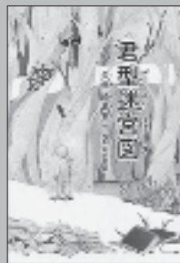
『君知迷宮図』 久米絵美里／作 元本モトコ／絵 朝日学生新聞社

記憶を失い、見知らぬ人間たちの中で目覚めたぼく。なんとここは世界の記憶が集まる迷宮だという。そこで出会った彼らの正体は…。前代未聞のファンタジー。『朝日小学生新聞』連載に加筆修正し、再構成。