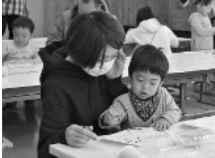
ひだまりっこ 「作ってあそぼう」 (大林児童館)

子どもたちが遊び 親たちも楽しめる そんな交流の場があります。 親子で手をつないで ぜひ遊びに来てください。