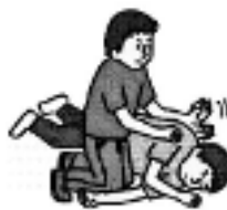
寝かせての背部叩打法