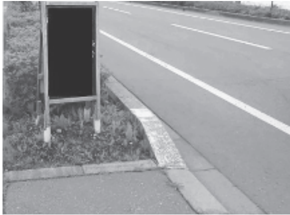
無許可で道路用地内に設置された広告物

また、屋外広告物の表示や設置に関することなど、ご不明な点がありましたら、ご相談ください。