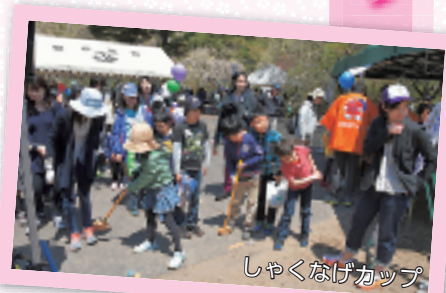
しゃくなげカップ