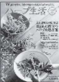
『ハーブ生活 エルボリストリに学ぶ 暮らしに役立つ ハーブの処方箋』 地球丸

暮らしに役立つハーブの処方箋 暮らしに役立つハーブの処方箋 心や体の不調を整えるおすすめハーブや精油、その使い方など、暮らしのあらゆる面で役立つハーブの力を紹介。ほか、ハーブと暮らしの私たちの実例、ハーブ栽培の基本、ストックハーブが生きる体ばかりかレシピなどを収録。