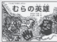
『エチオピアのむかしばなし むらの英雄』 わたなべしげお／文 にしむらしげお／絵 瑞雲舎

昔、ある村の12人の男たちが、粉を挽いてもらうために町へ行った。帰り道、1人が仲間を数えたが、自分を数えるのを忘れたので11人しかいなかった。誰かがヒョウにやられたと思いついた男たち。さて、それからどうなった？