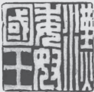
国宝「漢委奴国王(かんのわのなのこくおう)金印 印影