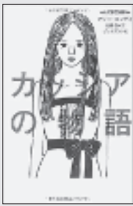
『カッシアの物語』 アリー・コンディ／著 高橋啓訳 プレジデント社

人間の文明が減じた後に再建された社会。それは役人がすべてを管理し、決定する社会だった。病気や不安や争いごとのいつさいない、健康で平和な社会のなかで、17歳の少女カッシアは、真実の愛と選択の自由を求めて旅立つ…。