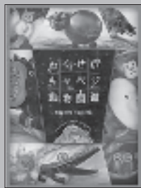
『わくせいキャベジ動物図鑑』 tupera tupera／作・絵 アリス館

銀河のかたすみにある、わくせいキャベジ。黄緑色に輝く星には、ふしぎな生き物たちがすんでいます。冷たくイボのあるキュワニ、でこぼこした網目模様のラットセイなど、そこにすむ生き物たちの姿やその生態を紹介します。