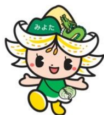
御代田町観光キャラクター みよたん