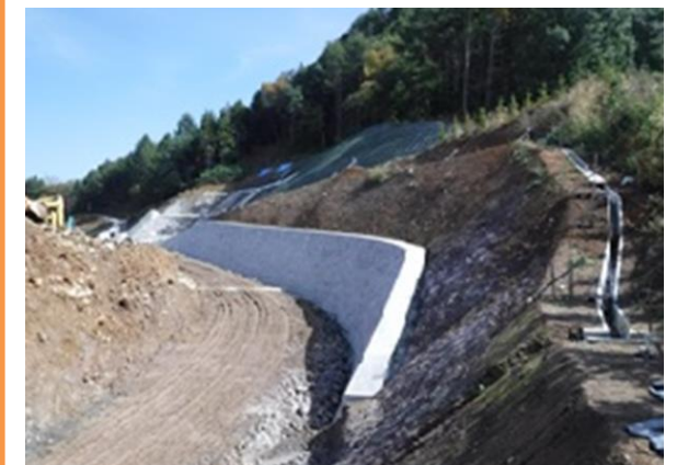
▲西(パラダ)側より [H29.10.18撮影]