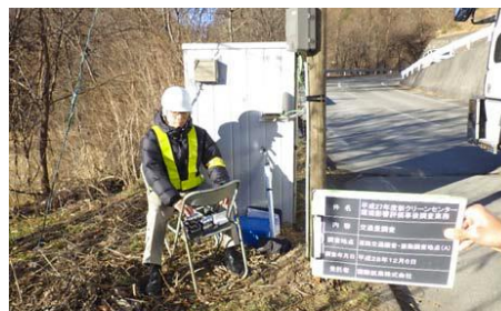
▲沿道で実施した交通量調査の様子

今回の報告書には、工事開始前に先行して開始した動植物に対する環境保全措置に加え、大気質や騒音・振動といった生活環境系の調査結果も含まれています。調査した各項目は、環境影響評価における環境保全のための目標を満たした結果となりました。