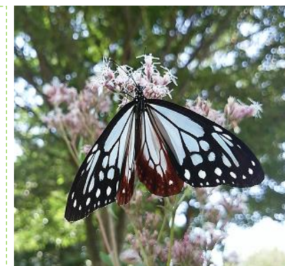
▲ フジバカマの蜜を吸うアサギマダラ

アサギマダラは、旅するチョウとも言われ、2,000km 飛ぶこともあるそうです。初めてアサギマダラを目にすると、この小さな体のどこにそんな力が潜んでいるのかなと不思議に思うのと同時に、ゆらゆらと優雅に飛ぶ姿に魅せられてしまう方も多いのではないのでしょうか。来年もこの場所に多くのアサギマダラが訪れ、たくさんの人の笑顔を運んでくれることを願っています。