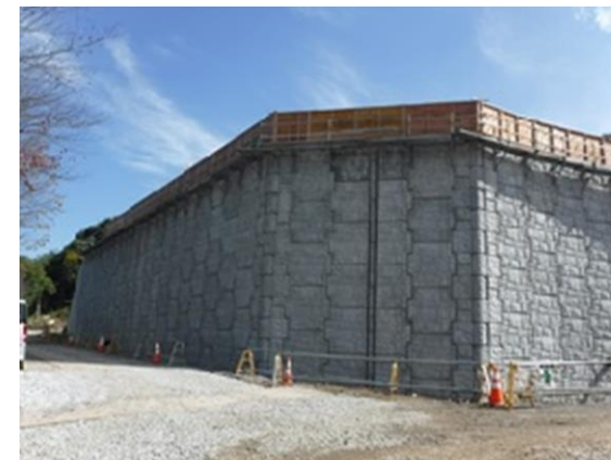
▲出入口付近より [H29.10.18撮影]

① 高さ約10mの補強土壁(テールアルメ擁壁)です。一部が最上段まで積みあがりました。