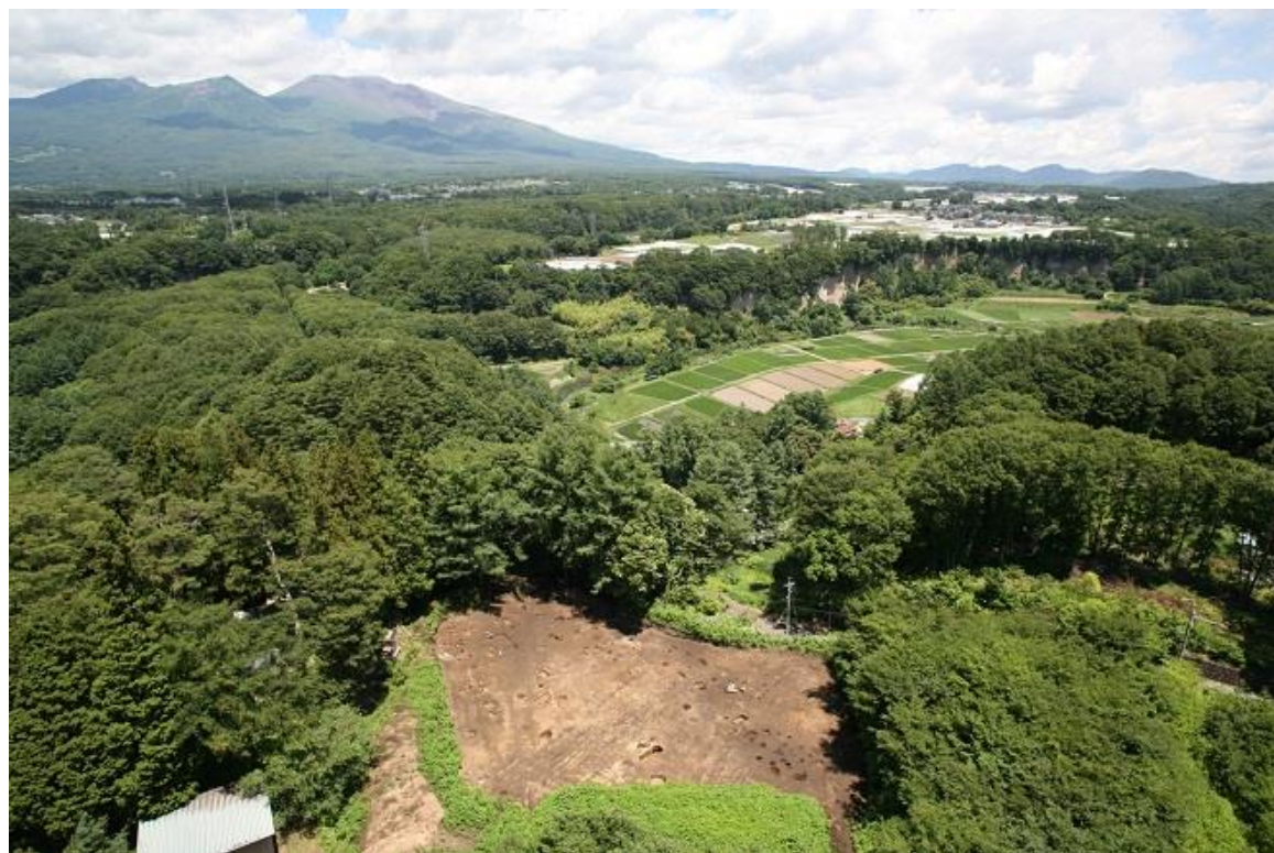
▲ 湯川沿いに広がる面替小谷ヶ沢遺跡 縄文時代と平安時代の遺跡