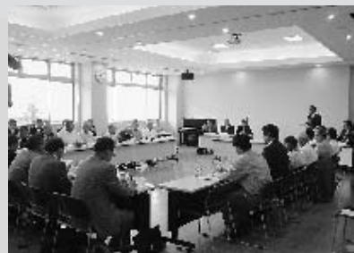
【第1回総合検討委員会】

委員に選任された23名の方に委嘱書が授与され、3市町での計画の経過や今後の検討項目について確認しました。また現地調査を実施している生活環境影響調査について、その概要を説明し、苗畑の立地検討地を視察しました。 【関連記事：平成17年広報やまゆり7～9月号「エコステーションだより①～③」に掲載】