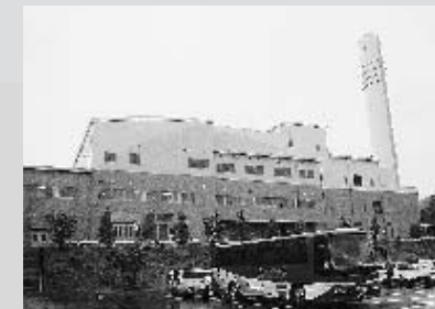
【事例調査で訪れた栗東市環境センター】