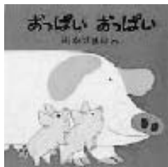
「おっばい おっばい」 わかやま けん/さく 童心社

『おっばい おっばい』 ページを開くと、子ザルが大泣きしています。おなががすいて、かあさんザルを探します。次のページでは子ザルがかあさんに抱っこされて、おっばいを飲んでいきます。子どもの健やかな成長を願う、温かさや幸せに満ちています。 ほかに、熊や牛なども登場しますが、表紙に登場しているブタはとでも子だくさん。そのページにはびつくりです。